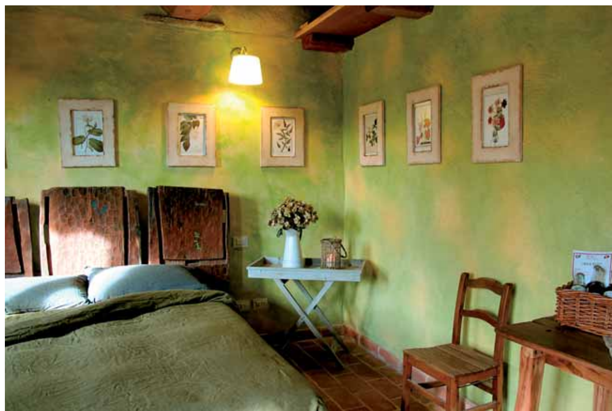
In alto, un'immagine della Stanza del Ferro e sotto quella del Giardiniere: da un lato una stanza che racconta di come la vita forgi l'uomo e il suo carattere, dall'altro un ambiente per coltivare l'anima...