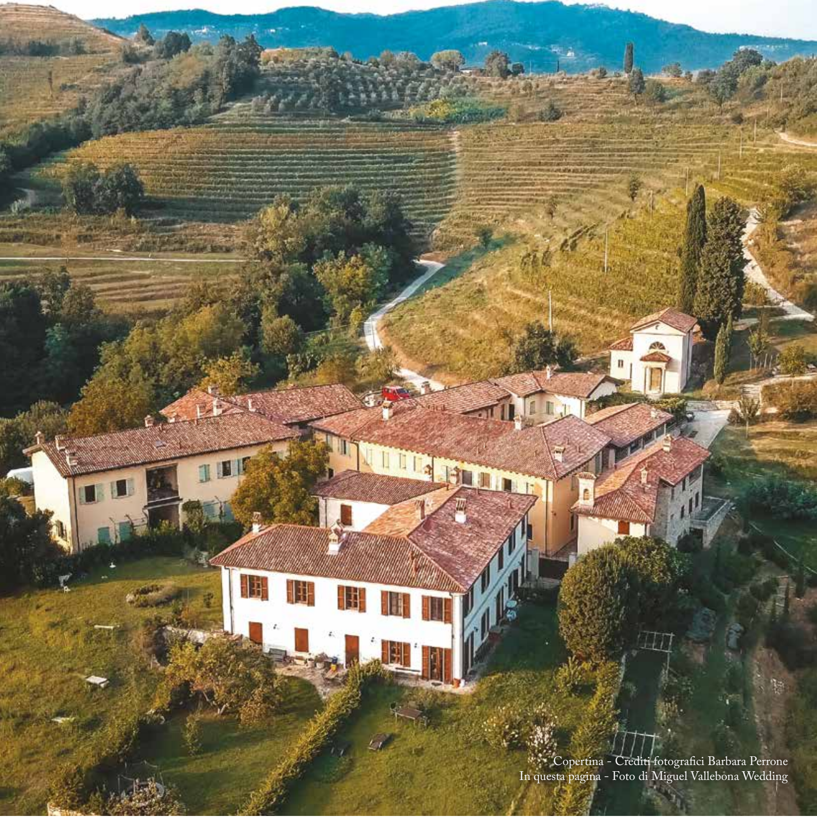
Copertina - Crediti fotografici Barbara Perrone In questa pagina - Foto di Miguel Vallebona Wedding