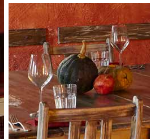
Les assiettes blanches CONFÈRENT BEAUCOUP D'ÉLÉGANCE grâce à leurs formes rondes et fuselées.

Les tissus de couleurs vives et féminines sont équilibrés par la couleur bois des chaises et l'orange des murs, qui apportent une touche de couleur à la pièce.