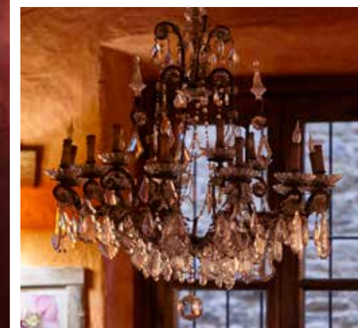
Le chandelier noir ET LA SILHOUETTE DU SERVEUR se marient au ton général de la table.